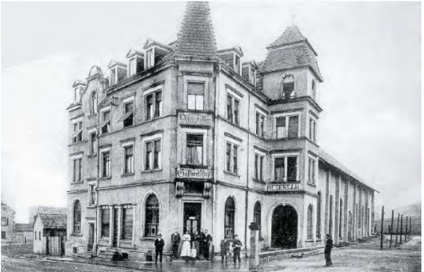
Le « Riesensaal », après la Seconde Guerre mondiale, deviendra pendant plusieurs décennies le « Cinéma Rex »

Guy. À ce niveau de l'Allée Saint-Joseph, là où se situe l'actuel rond-point, la chaussée était traversée par la voie ferrée venant du Creutzberg et se dirigeant, par la rue Saint Guy et l'arrière des rues Saint Charles et Sainte Marthe, vers l'usine pour y déposer les pierres de taille et les moellons en provenance de la carrière de la Chapelle, matériaux utilisés dans les divers ateliers des forges et dans les chantiers de construction de la commune. Après l'arrêt des forges, cette voie fut prolongée en 1908 jusqu'à l'entrée de Forbach pour acheminer, plusieurs fois par jour, jusqu'en septembre 1962, les mineurs vers les puits des Houillères de Petite-Rosselle.