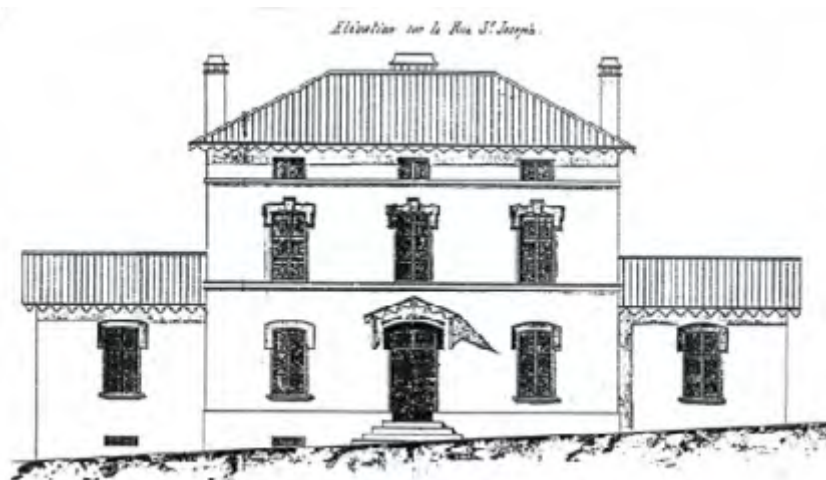
Vue de la Maison d'alimentation située parallèlement au tracé de l'Allée Saint-Joseph

Après avoir évoqué les rues de «L'Ancienne Direction» à Vieux-Stiring puis «La rue du Coin», à Verrerie-Sophie, le présent article relate l'histoire du «Boulevard Saint Joseph» situé dans le quartier du Centre, troisième quartier à s'être développé dans l'Histoire de la commune. Cette artère, lors de sa mise en place des rues de ce quartier, reçut le nom d'«Allée Saint Joseph», que la majorité de la population stiringeoise dénommait en «Platt»: «Die Josef Allee». Cette voie faisait partie de la première urbanisation de la future commune de Stiring-Wendel, désignée à l'époque par: «Stiring-Nouveau» ou, par les habitants de la jeune commune: «E's Dorf!».