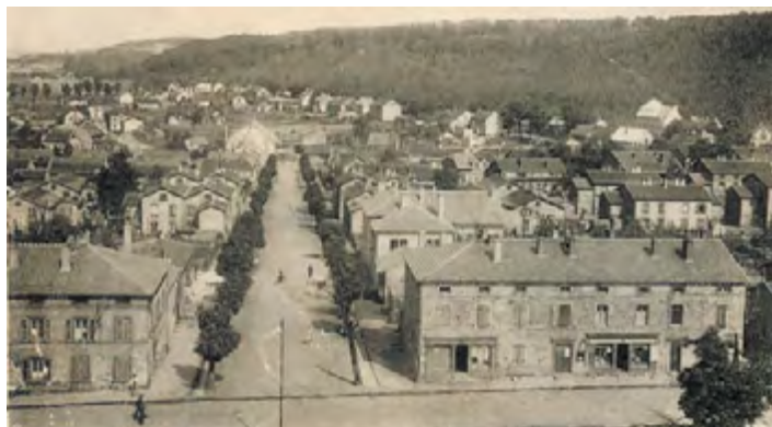
Vue de l'Allée Saint Joseph vers 1950, avant son prolongement jusqu'à la rue de la République

Guy. À ce niveau de l'Allée Saint-Joseph, là où se situe l'actuel rond-point, la chaussée était traversée par la voie ferrée venant du Creutzberg et se dirigeant, par la rue Saint Guy et l'arrière des rues Saint Charles et Sainte Marthe, vers l'usine pour y déposer les pierres de taille et les moellons en provenance de la carrière de la Chapelle, matériaux utilisés dans les divers ateliers des forges et dans les chantiers de construction de la commune. Après l'arrêt des forges, cette voie fut prolongée en 1908 jusqu'à l'entrée de Forbach pour acheminer, plusieurs fois par jour, jusqu'en septembre 1962, les mineurs vers les puits des Houillères de Petite-Rosselle.