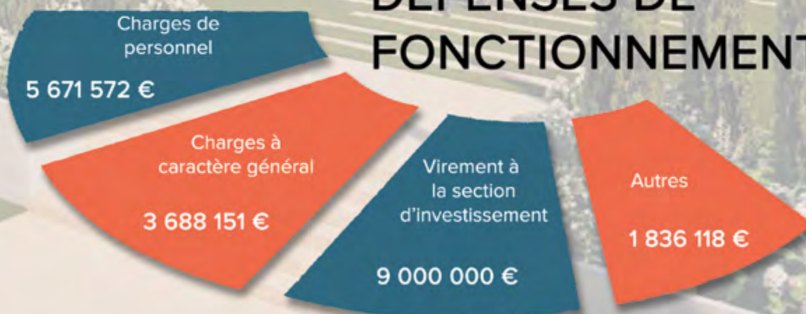
Image d'arrière plan : avant-projet du réaménagement de la Coulée Verte